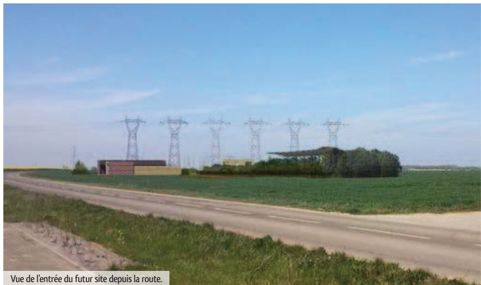
Vue de l'entrée du futur site depuis la route.