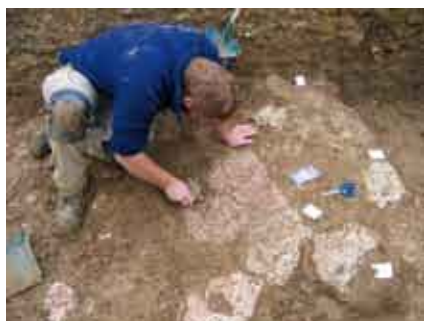
Fragments de peinture murale découverts dans le comblement d'une cave.

Dans le cadre de l'extension de la zone industrielle de Gellainville, deux opérations ont eu lieu sur les sites « le Radray » en 2007, « Les Beaumonts » en 2009. Au Radray, à une ferme gallo-romaine (du I er au IV e siècle) composée