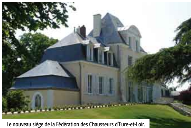
Le nouveau siège de la Fédération des Chasseurs d'Eure-et-Loir.

C'est dans un environnement riant et bucolique à souhait que sont donnés les cours préparatoires au passage du permis de chasser. De même, les associations spécialisées (tir à l'arc, association des jeunes chasseurs, chasseurs de grand gibier, de gibier d'eau etc.) peuvent en bénéficier et apprécier les moyens mis à leur disposition.