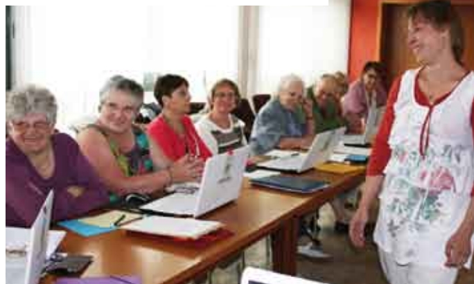
NATHAIDE – 07 50 60 95 42 – nathaide28@gmail.com