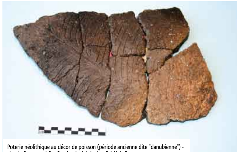
Poterie néolithique au décor de poisson (période ancienne dite "danubienne") - site de Sours - crédit : Service Archéologie - Frédéric Dupont

La fouille la plus récente concerne en 2010 le site "les Vergers" à Mignièrès, longtemps dédié à l'agriculture, qui s'avère être un village néolithique, avec des habitats communautaires et des fours extérieurs, utilisés pour la cuisson de galettes ou pains. Puis s'installe un vicus (hameau) gallo-romain avec des maisons en pierre. La présence d'un atelier de forge et de fours de métallurgie à la fin de la