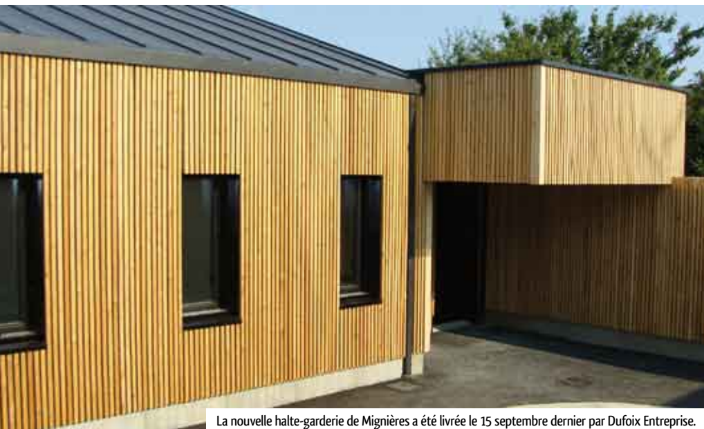
La nouvelle halte-garderie de Mignières a été livrée le 15 septembre dernier par Dufoix Entreprise.

Julien Dufoix : « La préfabrication en atelier permet un délai de construction réduit et maîtrisé. Les conditions météorologiques n'ont pas d'incidences sur nos temps d'exécution. Ce sont en outre des constructions écologiques. Ce concept de mur crée une ambiance particulière et apporte un confort inégalable. Nos maisons sont contemporaines et réalisées sur mesure à la demande du client. »